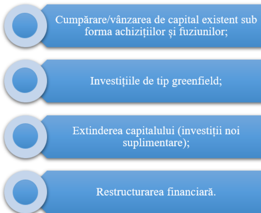
Graficul nr. 2: Operațiuni incluse în cadrul investițiilor directe