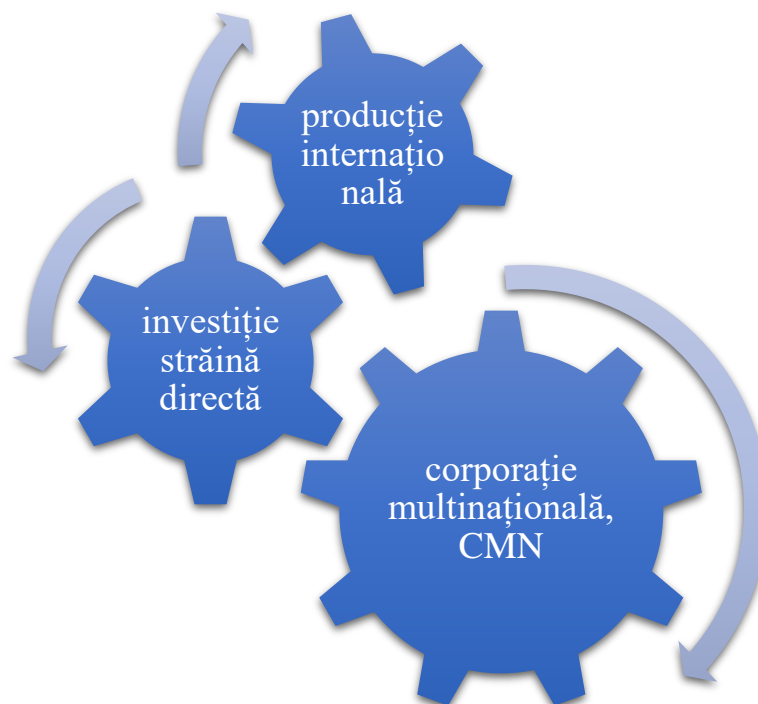
Graficul nr. 3: Structura în care se manifestă ISD-urile